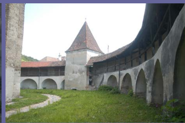
19. Mai 2011, Kirchenburg Valea Viilor / Wurmloch: UNESCO-Welterbe