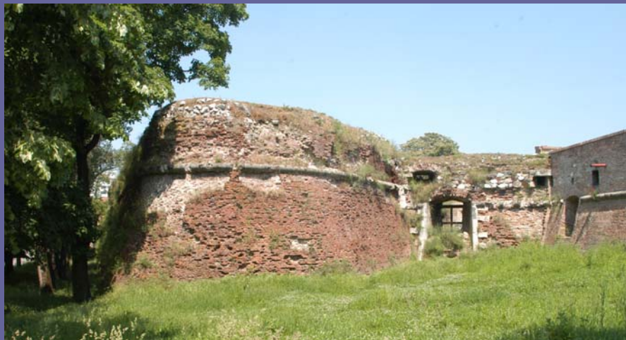
20. Mai 2011, Oradea / Großwardein: Festung (16.-18. Jh.)