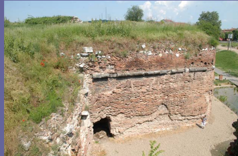
20. Mai 2011, Oradea / Großwardein: Festung (16.-18. Jh.) – Zustand der Bastionen