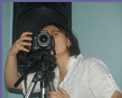
21. Mai 2011, Șimleu Silvaniei: Letzter Konferenztag