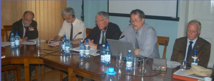
Sergiu Nistor, ↑ Präsident ICOMOS Rumänien