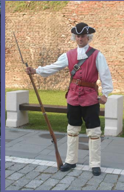
19. Mai 2011, Alba Iulia: Rundgang westlicher Bereich