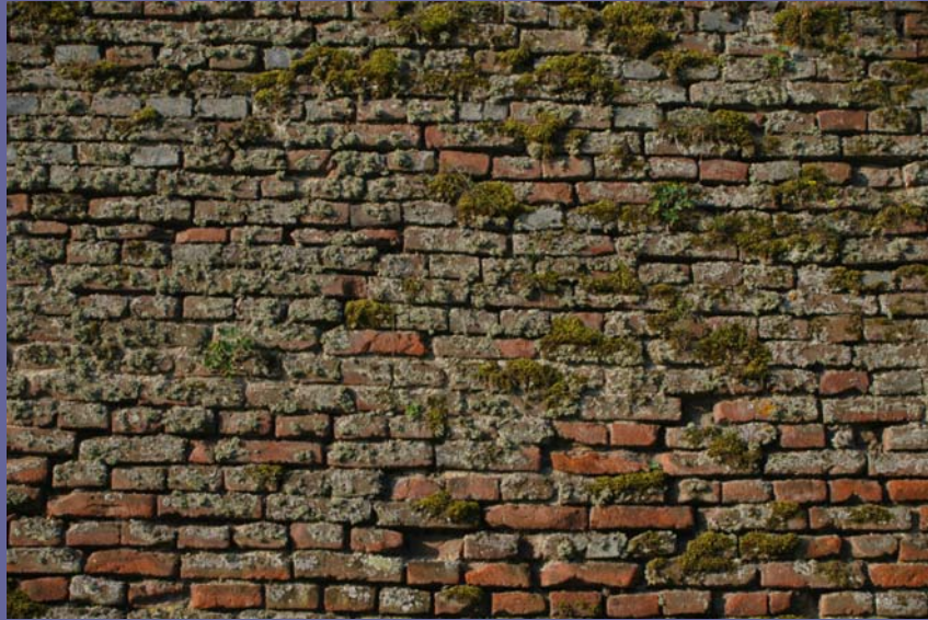
19. Mai 2011, Alba Iulia: Kontereskarpe