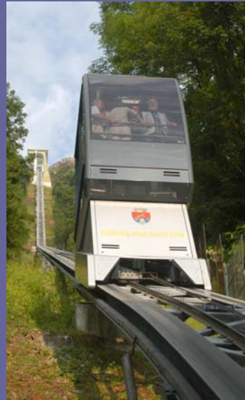
19. Mai 2011, Deva: Burg (1269-1849)