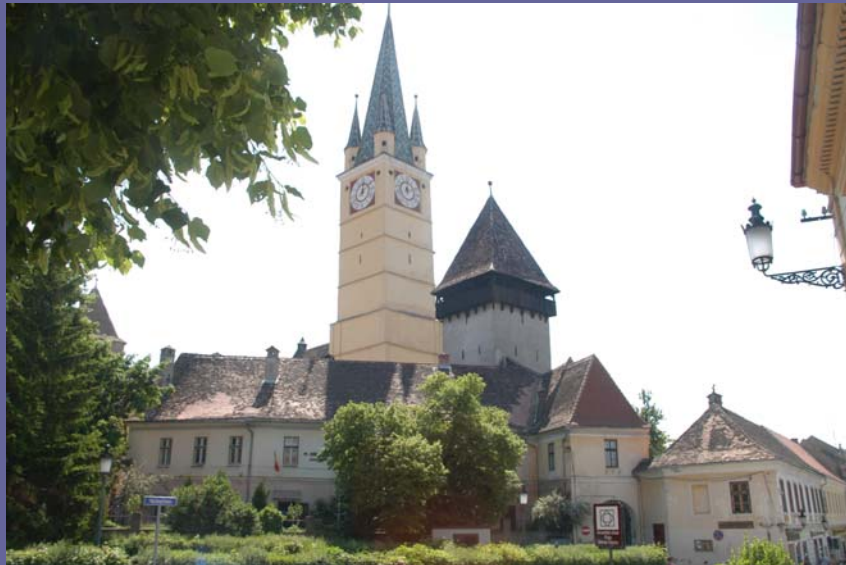
19. Mai 2011 Stadtbefestigung und Kirchenburg Mediaș