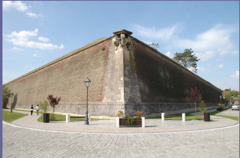
18. Mai 2011, Alba Iulia