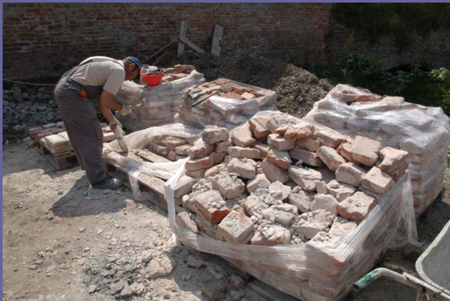
20. Mai 2011, Oradea / Großwardein: Festung (16.-18. Jh.)