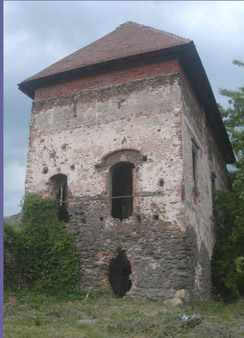
20. Mai 2011, Șimleu Silvaniei: Schloßreste der Familie Báthory