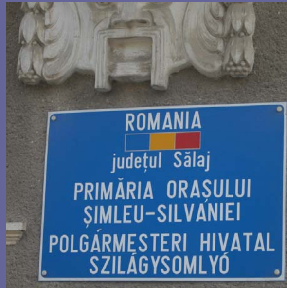
20. Mai 2011, Fahrt von Oradea nach Șimleu Silvaniei