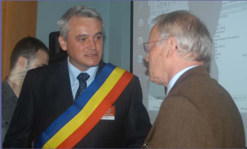
↑ Septimiu Țurcas, Bürgermeister Șimleu