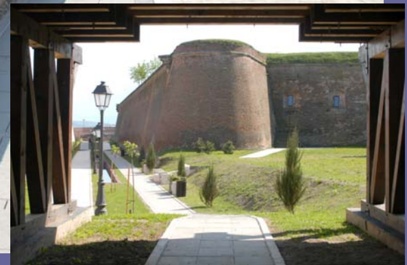
18. Mai 2011: Südlicher Rundgang um die Festungsanlagen